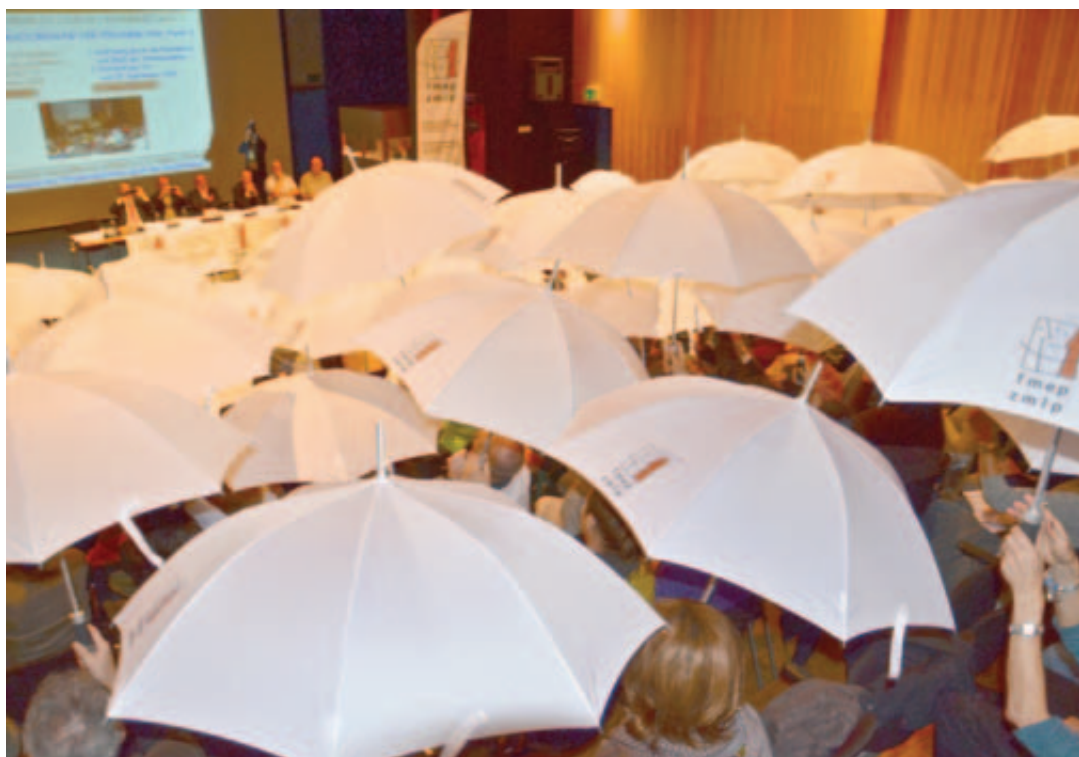
Les délégués on reçu samedi à Sion un parapluie, «symbole du rôle de protection de la FMEP». Ils l'ont même utilisé pour voter. LE NOUVELLISTE

compris. Et ceux qui, comme la FMEP et le RSV exigent une égalité de traitement. Maurice